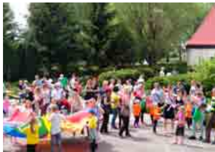
Dzień Dziecka na Podzamczu

Ośrodek przygotował dla nich ciekawe propozycje wakacyjne. Zajęcia odbywać się będą od 1 lipca do 31 sierpnia, od poniedziałku do piątku, w godz. 9: - 14. Uczestnicy codziennie otrzymają drugie śniadanie.