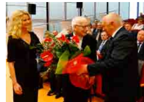
Życzenia od władz miejskich Kalisza