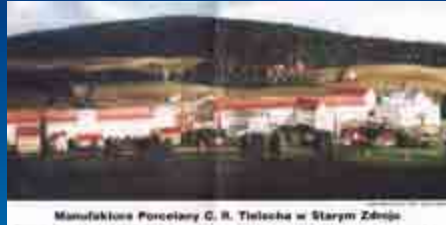
Manufaktura Porcelany C. R. Teischa w Starým Zboj

Od kwietniowo-majowej edycji 2002 r. (obok WIK prezentował przez lata kolorowe rozkładówki, które zmieniały swój charakter (poniżej)