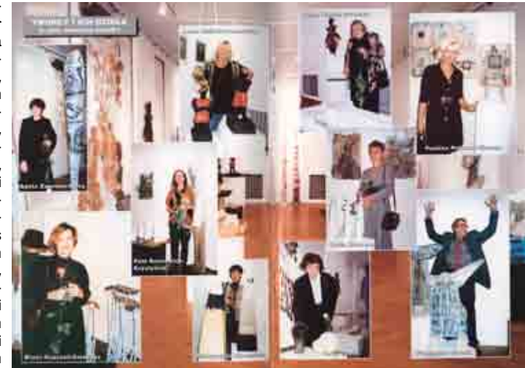
Jednorazowa kolorowa rozkładówka w WIK z listopada 1996 r.