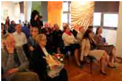
Noc Bibliotek pod Atlantami