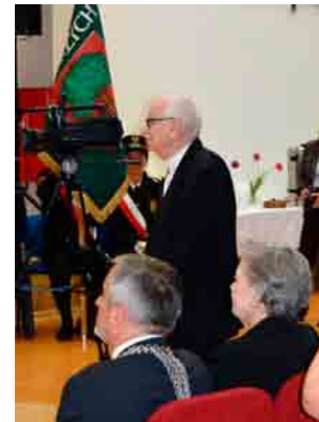
Wystąpienie Maestro byto, jak zawsze, celne i pełne swady