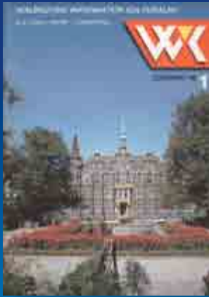
Ten WIK to początek naszej 20 historii