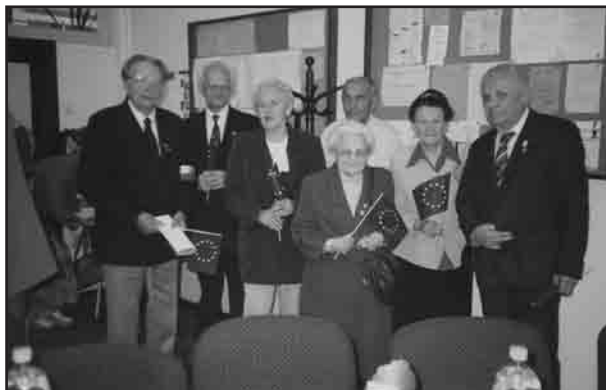
Spotkanie z okazji przyjęcia Polski do Unii Europejskiej