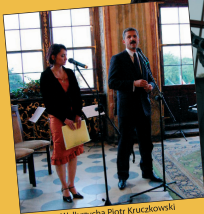
Prezydent Wałbrzycha Piotr Kruczkowski otworzył Festiwal. W tym roku wystąpienia tłumaczone były na j. angielski