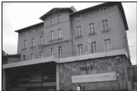
Budynek teatru już wkrótce będzie wyglądał jak nowy

P onad 9 mln zł wyda na gruntowaną modernizację swojej siedziby Teatr Dramatyczny w Wałbrzychu. W ciągu dwóch lat powstanie nowa, ekologiczna kotłownia, zostaną wymienione wszystkie okna i dachy, a budynek będzie zabezpieczony nowoczesną sygnalizacją przeciwpożarową. Zyska też strona artystyczna, bowiem gruntownej modernizacji zostanie poddana duża scena.