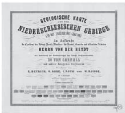
Karta tytułowa atlasu geologicznego Dolnego Śląska

Wystawa ze zbiorów Muzeum Przemysłu i Kolejnictwa w Jaworzynie Śląskiej. Składają się na nią fotografie plakatowe wykonane na terenie tego muzeum, które prezentują zabytkowy tabor kolejowy.