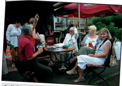
Stolik Poetów podczas Poranka