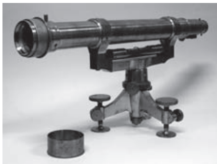
Niwelator Breithaupta z 1874 r.

Jest to wystawa ze zbiorów Starej Kopalni i zawiera zbiór starych map górniczych z byłych kopalń wałbrzyskich oraz urządzeń pomiarowych i przyrządów kartograficznych służących do sporządzania tych map.