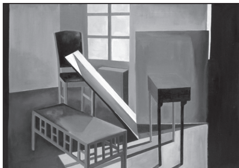
Z cyklu „Wnętrze”

Zajmuje się witrażem, tkaniną artystyczną. Realizuje prace malarskie na papierze, płótnie, jedwabiu.