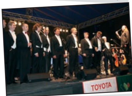
Letnia Serenada - Turniej Tenorów w Rynku