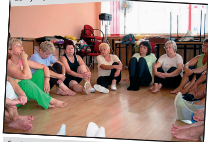
Seniorzy w sali prób w WOK