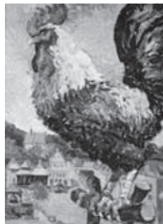
S. Serg - Kogut

W każdym kolejnym miesiącu planowane są prezentacje związane z kulturą, sztuką, osiągnięciami naukowymi współczesnej Rosji. Dni zakończy wielka wystawa prac artystów rosyjskich tworzących i mieszkających w Polsce, która odbędzie się w sierpniu 2010 r.