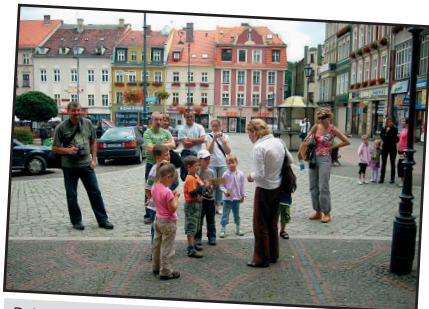
Dzieciom bardzo podobały się wycieczki po mieście