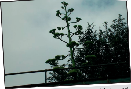
Kwiat agawy jest widoczny wysoko ponad dachem palmiarni