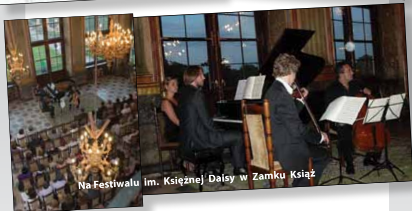
Na Festiwalu im. Księżnej Daiszy w Zamku Książ