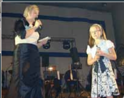
Na Festiwalu Piosenki Dziecięcej