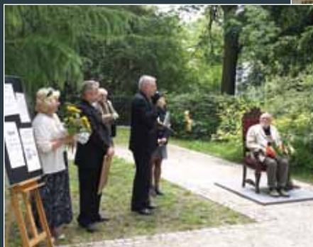
Fot. J. Drejer