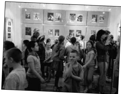
Na wystawie w Galerii Książki