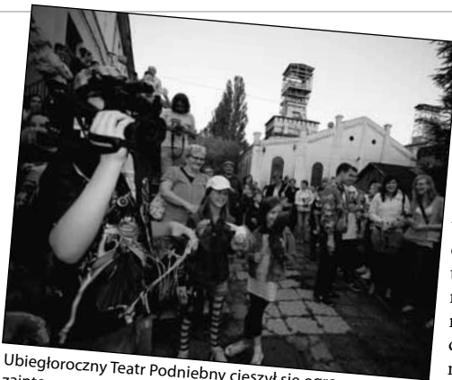
Ubiegłoroczny Teatr Podniebny cieszył się ogromnym zainteresowaniem.