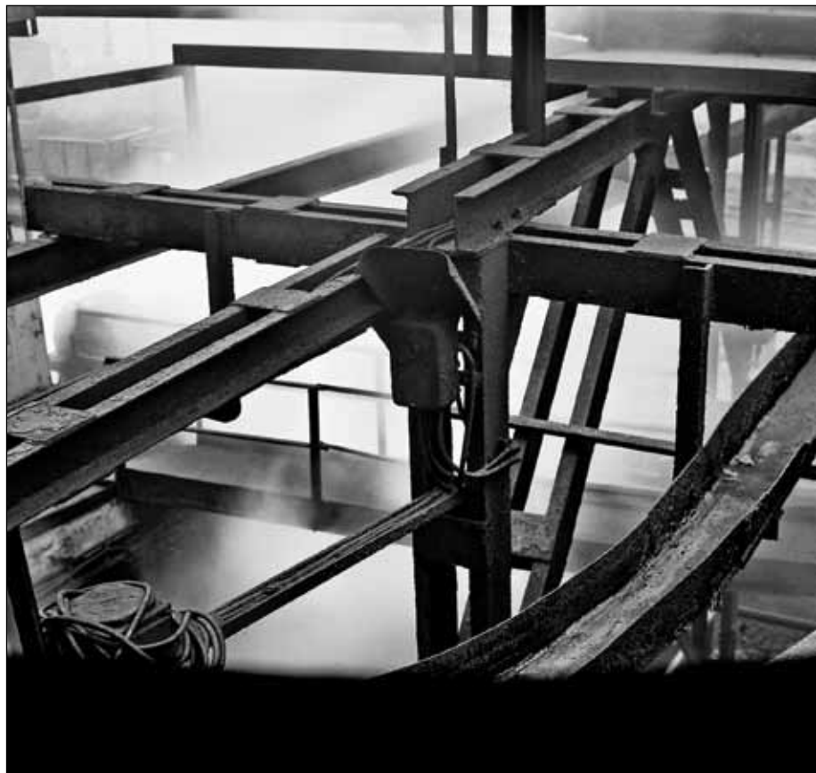
z cyklu „Zapis koksownia”