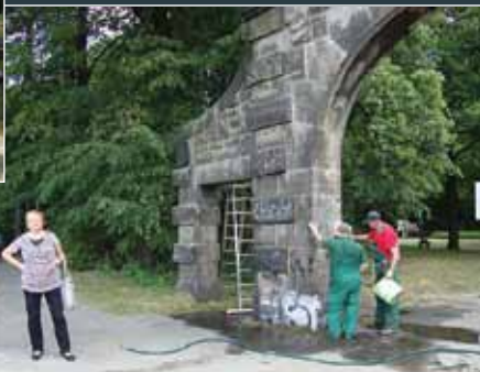
Wielkie porządki w Wałbrzychu