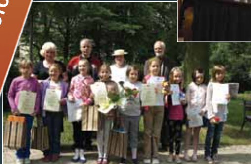
Ogrody Muzeum - laureaci i jury konkursu na najlepszy „Słowniczek terminów muzealnych”