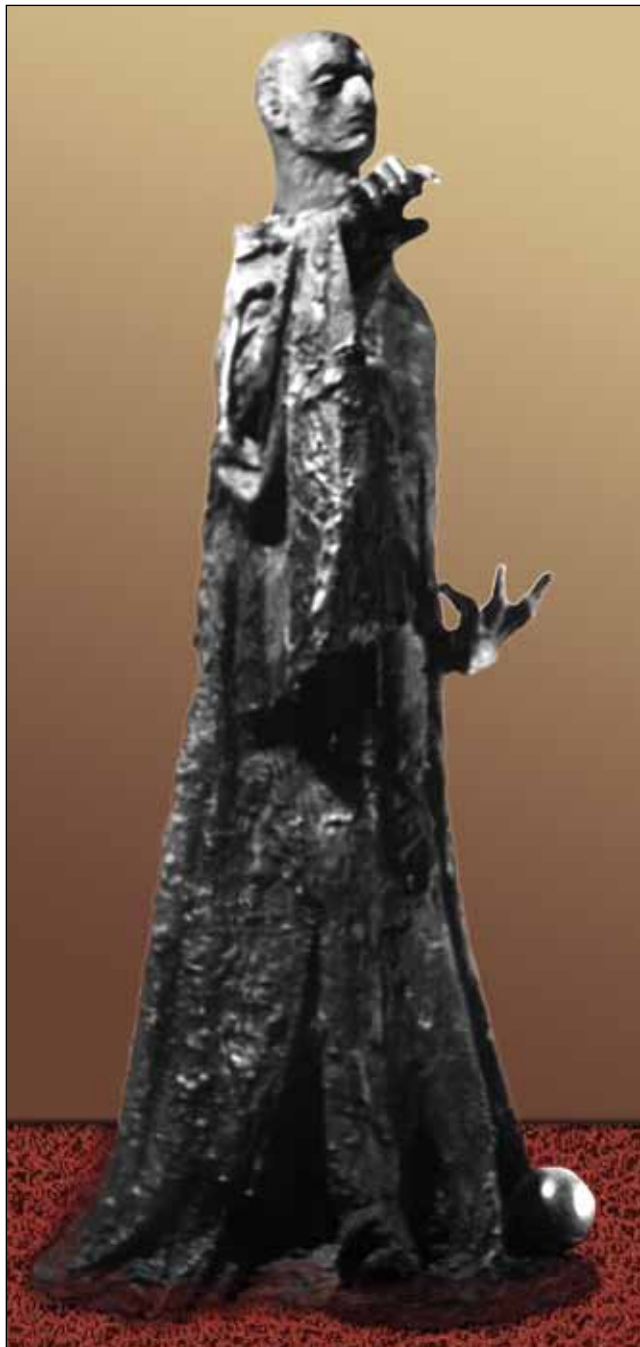
Płonący Giordano Bruno