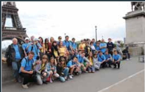
ZPiT „Wałbrzych” w Paryżu, po występach na festiwalu folklorystycznym w Saint Pierre des Corps